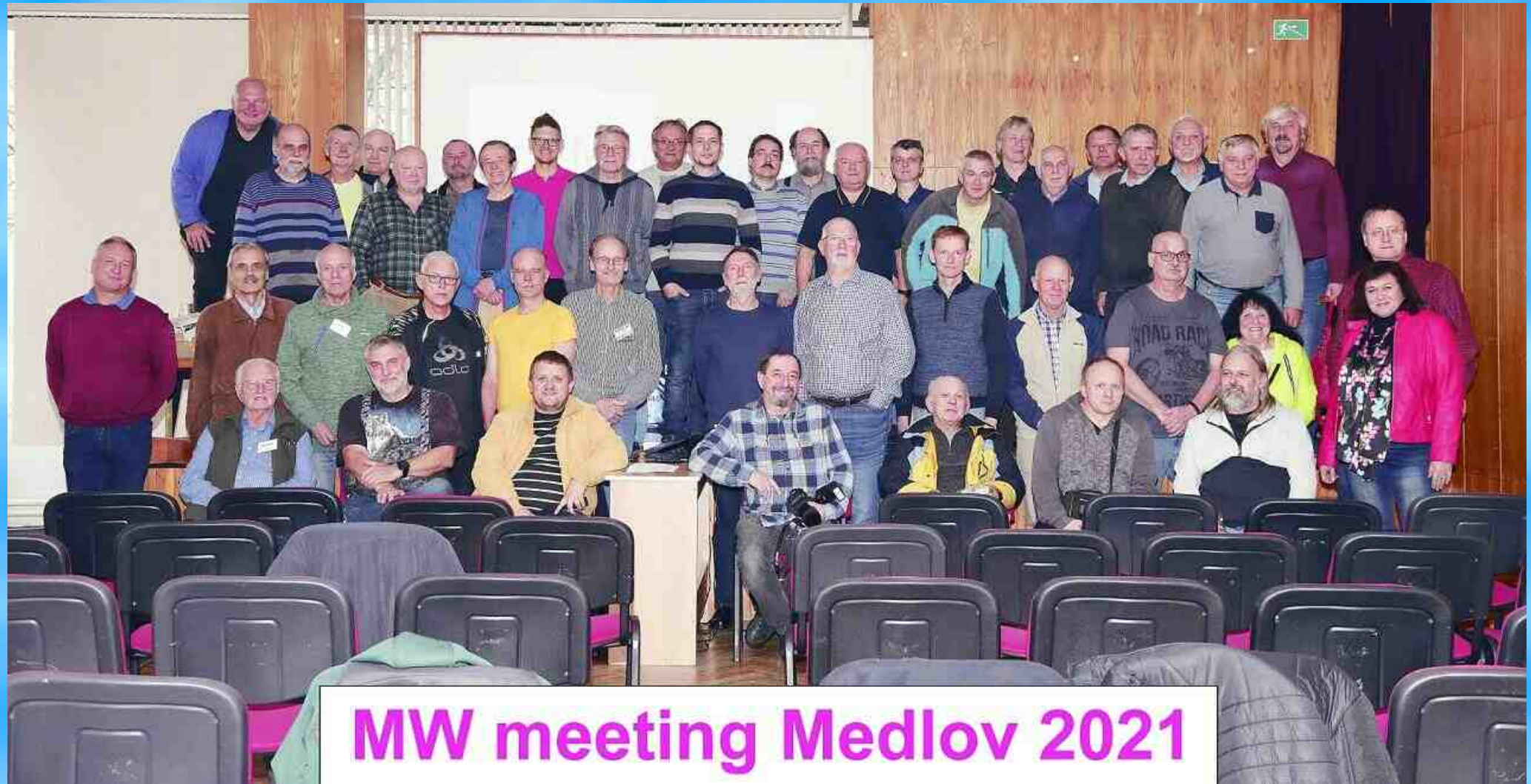
MW meeting Medlov 2021